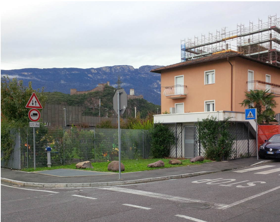
Fig.: Accesso centrale frigorifera