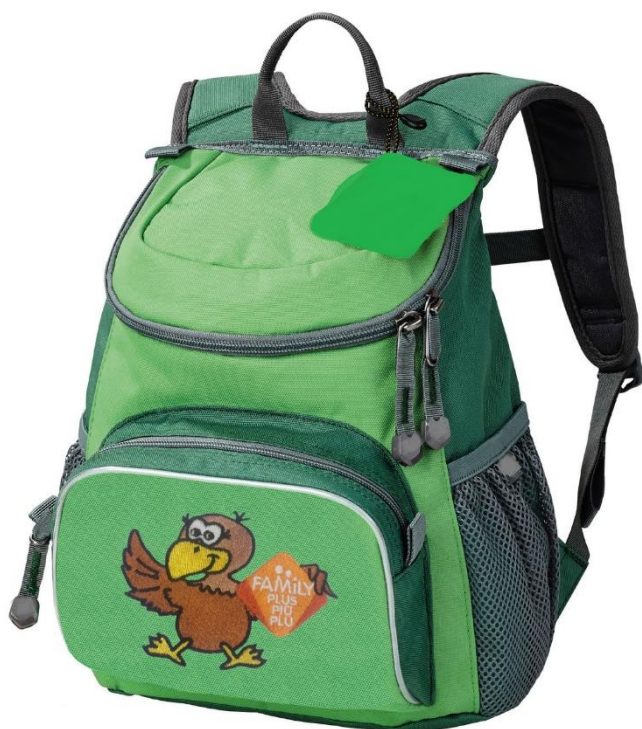
Immagine dello zaino da fornitura precedente a titolo indicativo:

Bild des Rucksacks aus vorhergehender Lieferung als Beispiel: