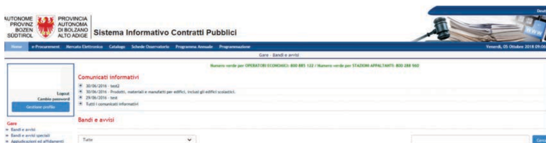
Figura 4 – Pulsante "Gestione profilo"

L'Operatore Economico, dopo essersi iscritto all'Indirizzario e quindi essersi collegato con la sua User e Password, può controllare lo stato della propria iscrizione all'Indirizzario, all'Elenco Telematico e alla relativa sezione per i Servizi di Architettura e Ingegneria mediante il nuovo pulsante "Gestione profilo" (posizionato sotto il link 'Cambio password' nel riquadro contenente lo username dell'OE, v. Figura 4).